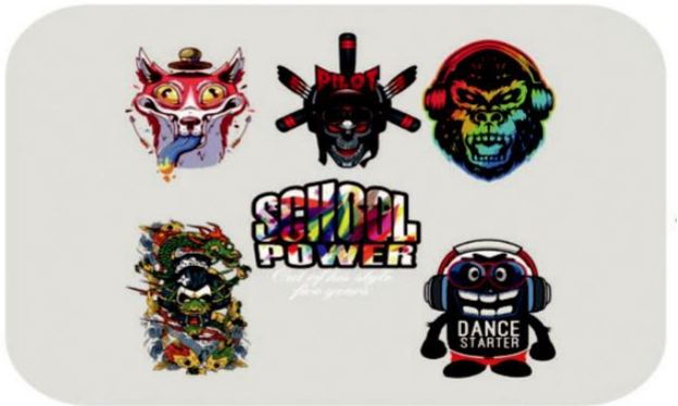
3 Output Images