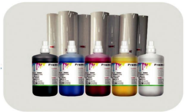
2 Pigment ink + PET Film