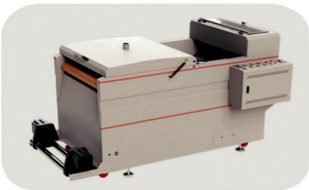
4 Auto powdering & drying 2 in 1